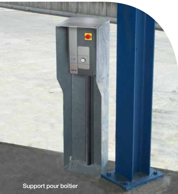
Support pour boîtier