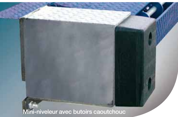
Mini-niveleur avec butoirs caoutchouc