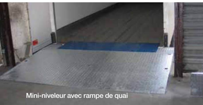
Mini-niveleur avec rampe de quai